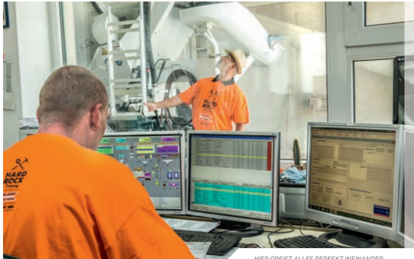
HIER GREIFT ALLES PERFEKT INEINANDER